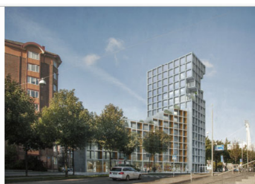
Vy från Bohusgatan

Byggplanerna för Ernst Fontells plats (tvärs över gatan från nr 26) har tagit tydligare form. Bland beslutspunkterna till mötet 14/6 i Fastighetsnämnden finns förslag till