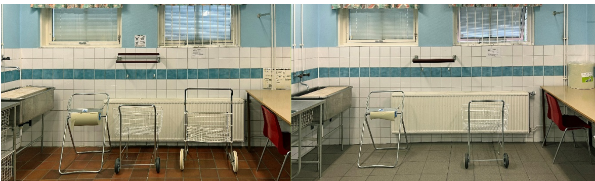
Bild till vänster tvättstuga 2, till höger tvättstuga 1.